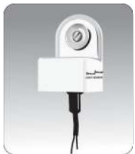
نحوه لخت کردن کابل چشم (به صورت کوتاه و بلند)

توجه:سیم های چشم، جهت خاصی برای نصب ندارند.