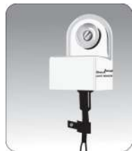
نصب چشم و کابل خروجی آن با استفاده از بست کابل